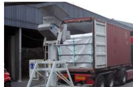
...of met speciale vul- en losapparatuur.