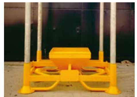
Voor het EXIM-rek zijn ook speciale vul- en los-systemen leverbaar.