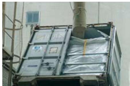
Vullen en lossen kan door middel van de zwaartekracht...