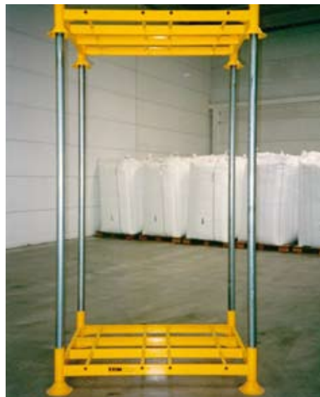
EXIM-Manurekken zijn door één persoon snel te (de-)monteren.

Maximale benutting van uw opslagruimte: stapelhoogte tot 9 meter. Geschikt voor alle FIBC's met een bodemmaat van max. 96 x 96 cm. Montage en demontage in 20 seconden. Zowel met vorkheftruck als handpallettruck te verplaatsen. Leverbaar in elke hoogte; standaard hoogtes van het rek zijn 160, 190 en 235 cm. Voor het EXIM-rek is een praktische los- en vultrechter leverbaar.