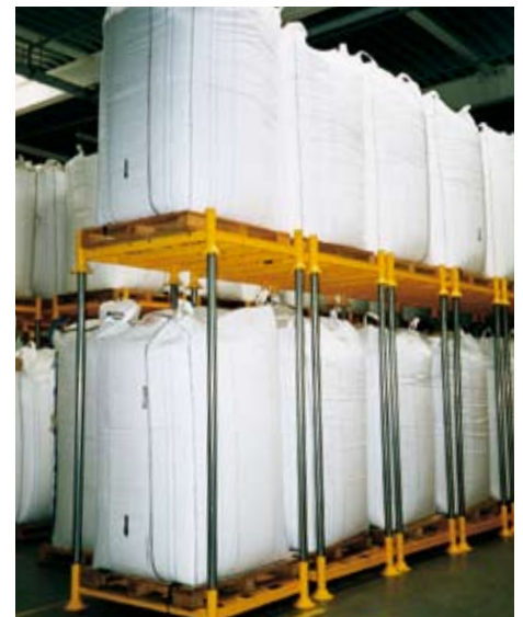
Met het EXIM manurek kan de omvang of indeling van een magazijn snel aangepast worden.