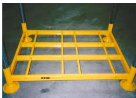
Geschikt voor standaard pallets en met een heftruck te verplaatsen.